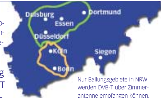
Nur Ballungsgebiete in NRW werden DVB-T über Zimmerantenne empfangen können.

Erste Erfahrungen zeigen, dass örtliche Gegebenheiten wie z.B. Innenhöfe oder Hochhäuser in der Empfangslinie auch innerhalb des DVB-T-Gebiets die Signale abschwächen